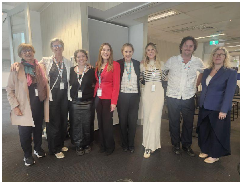
Com desculpas a Bronwyn Tarrant, que não aparece na foto.